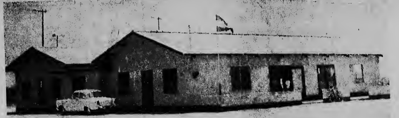
Un bista di Centro Juvenil Dakota, pa e nohentud di Dakota di awor padilanti lo por hanya diversion salud.

Di tal manera cu e bapor nobo, orgullo di Rotterdam, denter di un anja cu e la hai den awa por hasi su prome biaha, y segun ta worde spera e lo ta den haaf di New York dia 11 di September proximo. Dia 22 di September e ta bolbe pa Rotterdam. Asina lo tin 10 dia ocasion pa tene recepcionnan abordo pa e autoridanan mericano, relacionnan comercial y otro interesadonan. Despues e bapor aki lo hasi dos biaha mas pa New York, lo ta dia 20 di Oktober y 12 di November. Despues e ta bai hasi dos cruise grandi den Sur-América, Su Africa, Asia y Europa dia 1 di Februari anja 59.